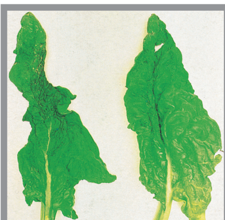
Slika 7. Listovi spanaća sa pečatima između nerava koje izaziva nematoda Ditylenchus dipsaci