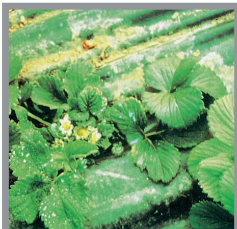
Slika 6. Biljke jagode sa simptomima patuljastog rasta i listovima sa pečatima između nerava koje izaziva nematoda Ditylenchus dipsaci