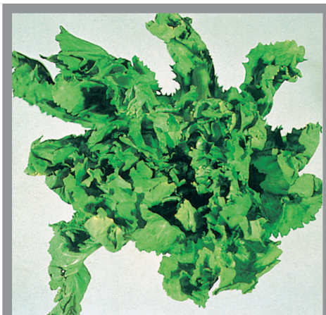
Slika 8 - Biljka žućanice (endivia) zaražena nematodom Ditylenchus dipsaci koja je blokirala razvoj centralnih listova busena

Gore navedene biljke, kada su napadnute nematodom D. dipsaci pokazuju slične simptome; pri ponovnom kretanju vegetacije u proleće kod njih se, uglavnom,