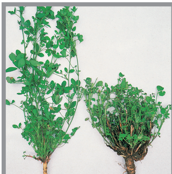
Slika 5. Biljka lucerke za stočnu hranu: zdrava (levo) i zaražena nematomom Ditylenchus dipsaci (desno)