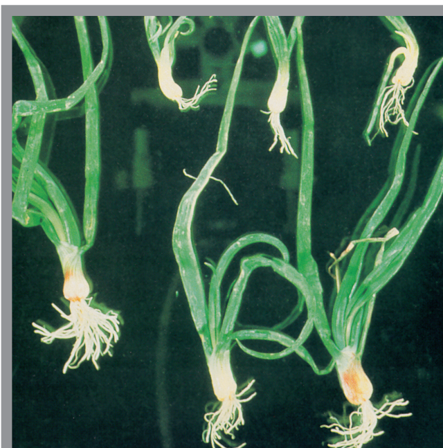
Slika 3. Biljke luka sa deformisanom površinom lišća zbog delovanja nematode Ditylenchus dipsaci