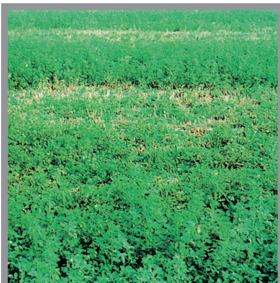
Slika 4. Polje lucerke za stočnu hranu sa mrljama koje formiraju biljke zaražene nematomom Ditylenchus dipsaci

Zaražene stabljike lucerke za stočnu hranu su zadebljale sa kraćim internodijama. Površina listova je deformisana i gubi boju zbog uništavanja hloroplasta (Sl. 4 i 5).